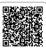
Товары для ванны