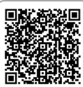
Товары для ванны